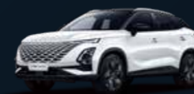
Khaki WHITE & Carbon Crystal BLACK roof