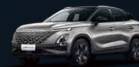
Aviation SILVER & Carbon Crystal BLACK roof