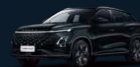
Carbon Crystal BLACK