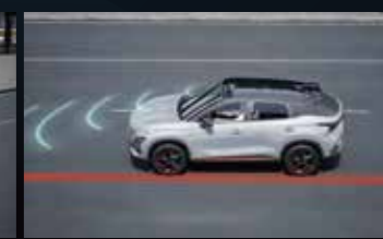
ELK Mantenimento della corsia in caso di emergenza