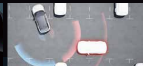
RCTA Avviso di collisione posteriore in retromarcia