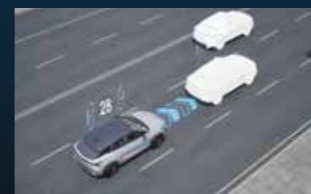
ACC Cruise control con velocità adattiva