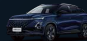
Late Night BLUE