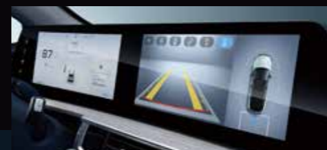
Camera a 360° Per una perfetta visuale durante le manovre