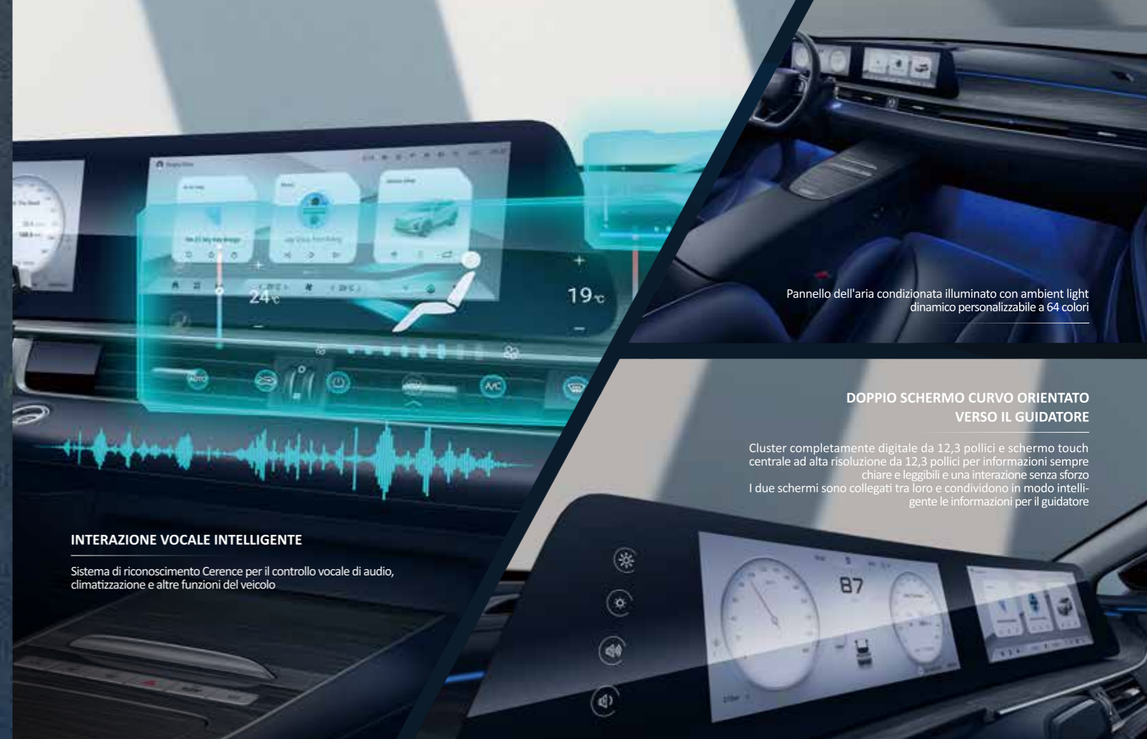
Pannello dell'aria condizionata illuminato con ambient light dinamico personalizzabile a 64 colori