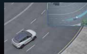
TJA Assistenza nel traffico intenso e ICA - Cruise integrato