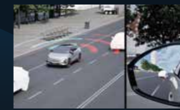
LCA Assistenza al cambio di corsia