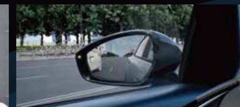
BSD Rilevamento dei punti ciechi