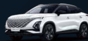
Khaki WHITE & Carbon Crystal BLACK roof