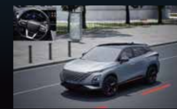
LDP Controllo dell'uscita dalla corsia