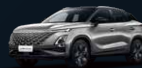
Aviation SILVER & Carbon Crystal BLACK roof