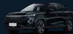
Carbon Crystal BLACK