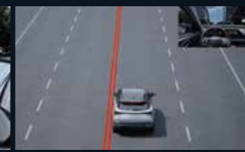
LDW Avviso di uscita dalla corsia